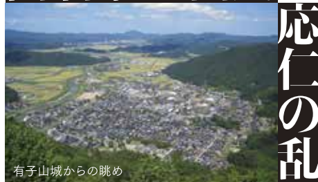
有子山城からの眺め