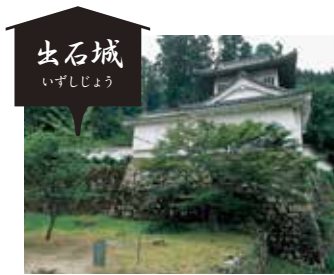
出石城 いずしじょう